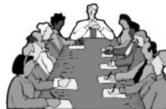
Por Felipe Fontanills.

Los Miembros de la Directiva reportaran el progreso de sus tareas específicas y se incluirán artículos de interés profesional y patriótico.