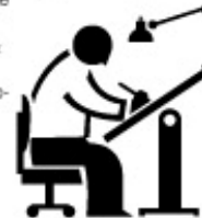
Por Ignacio González.

Pueden hacer sus reservaciones "online at www.miamidade.gov/bldg/workshop/login.asp " o póngase en contacto con "Communications & Public Information Section" en el teléfono (786) 315-2297 o Fax (786) 315-2894.